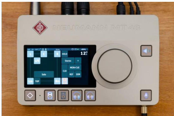
L'interface audio Neumann MT 48 s'enrichit de fonctionnalités très attendues, notamment pour les formats audio immersifs

Dans une salle isolée acoustiquement, appelée la « Whisper Room », des démos d'un choix de microphones Neumann seront proposées. Neumann profitera également de l'occasion pour annoncer trois nouveaux produits. L'interface audio MT 48 s'enrichit notamment de fonctionnalités très attendues, y compris pour les rendus dans des formats audio immersifs. Concernant le son live, Neumann dévoilera une capsule omni pour le système Miniature Clip Microphone (MCM) et des cols de cygne de plusieurs longueurs. Enfin, Neumann exposera plusieurs têtes de capsule voix pour systèmes sans fil.