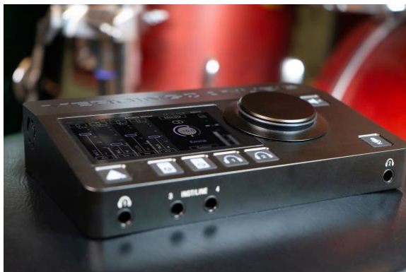
Merging Technologies fera des démonstrations de son logiciel Venue Mission et des capacités de mixage offertes aux musiciens

La seconde station de travail immersive sera dédiée aux interfaces audio de Merging Technologies et notamment au logiciel Venue Mission de la marque pour l'interface audio Anubis, qui promet de révolutionner les workflows des musiciens live et des ingénieurs du son, en leur conférant un contrôle sans précédent sur tout l'écosystème audio via une interface utilisateur intuitive couplée à un mixeur 16 canaux.